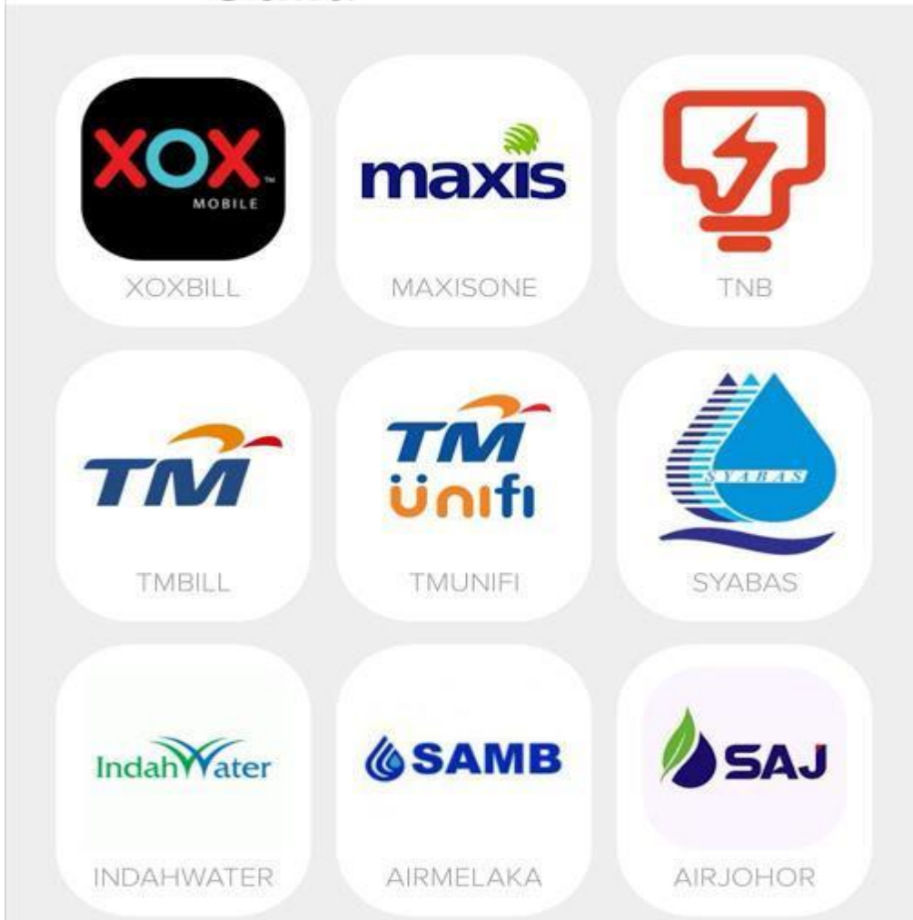
Gambar 4: Antara bil-bil yang boleh di bayar di ShiroiPay