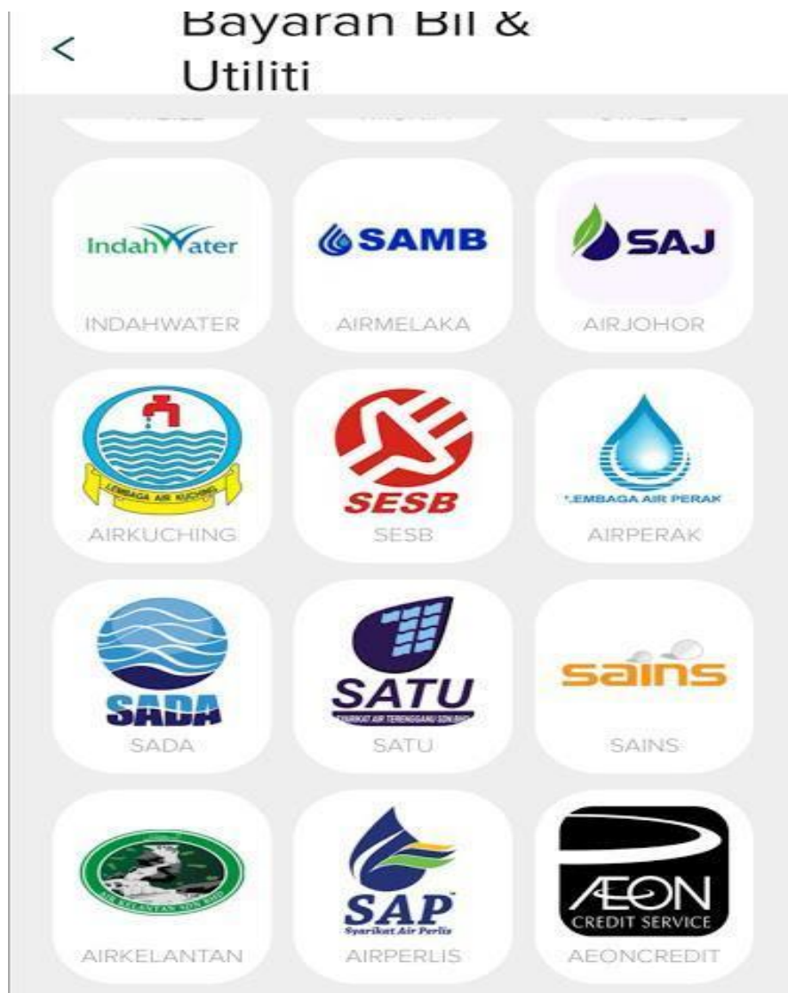
Gambar 5: Antara bil-bil yang boleh di bayar di ShiroiPay