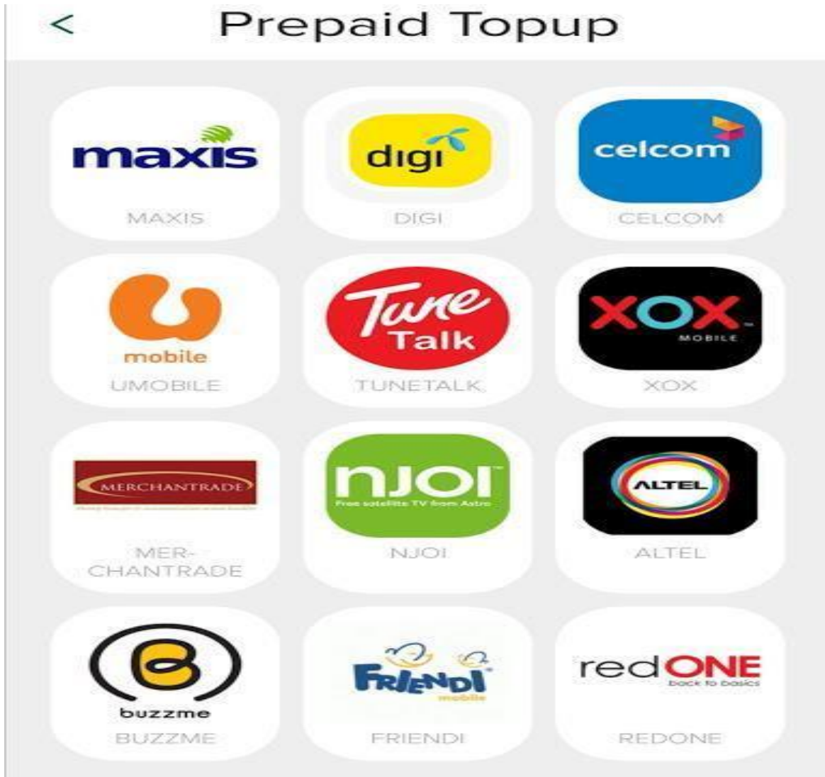
Gambar 1: Antara topup telco yang boleh tambah nilai di ShiroiPay.