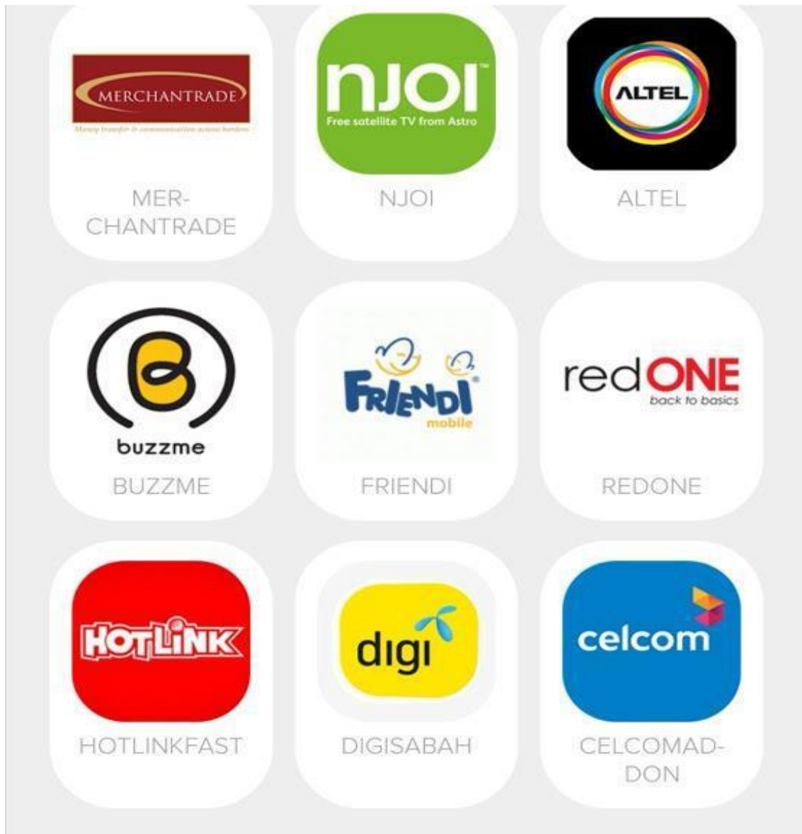
Gambar 2: Antara topup telco yang boleh tambah nilai di ShiroiPay.